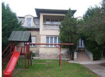
Szent I. h. u. 46.