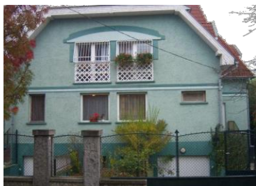
IV. u. 47. A és B

Mind az 7 csoportunk vállalja a különleges szükségletű, illetve 3 csoportunk a speciális szükségletű gyermekek integrált nevelését.