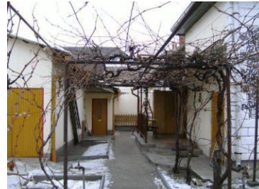
Nagysándor J. u. 149.