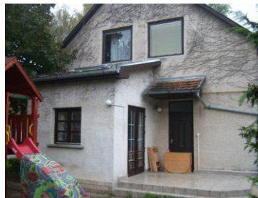
Farkasbab u. 24.

A fiataloknak nagykorúságuk elérése után 3 utógondozói lakásotthonunkban – 2 lakásban 4 férőhellyel, illetve egy 10 fős csoportban - tudunk ellátását biztosítani 24 éves korukig.